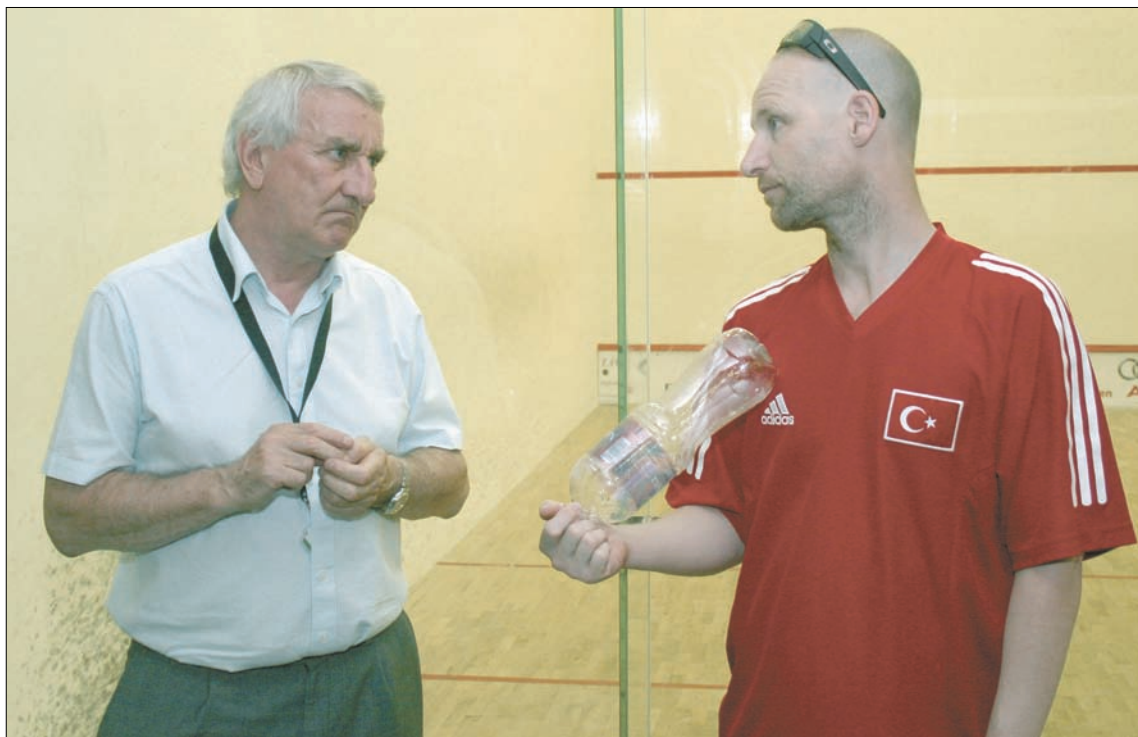
Az ESF alelnöke a török mezbe bújt magyar-ír játékos-edzővel...