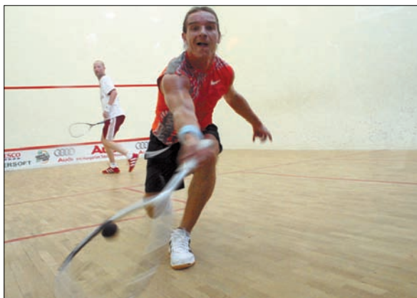
A kétszeres bajnok minden erőfeszítése kevés volt.