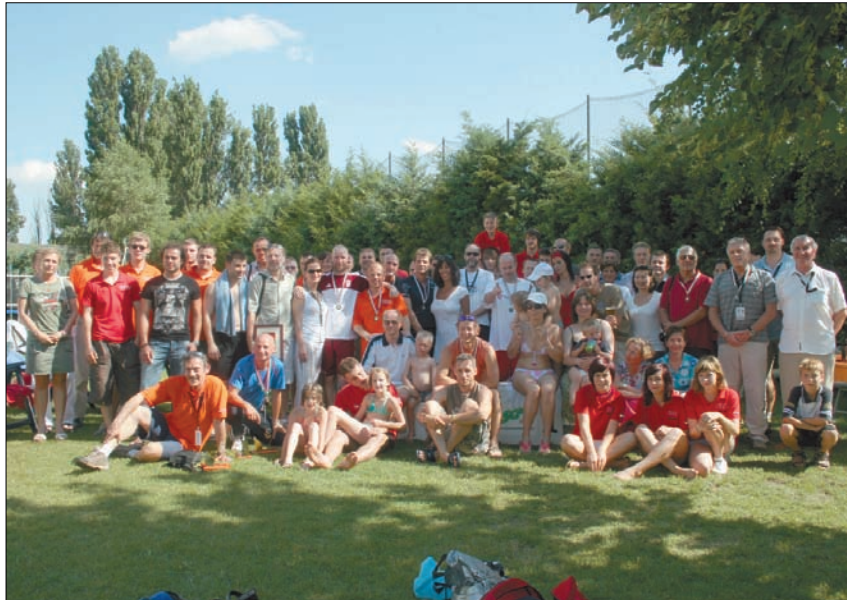
Egy baráti társaság töltött egy kellemes hétvégét a szegedi Squash Clubban.

Három nap fallabda, buli és barátkozás a Hungarian Mastersen